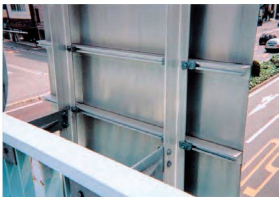
標識板 1 (既製材→アルミ板・高リブ・Tリブ・ ツメボルト使用)