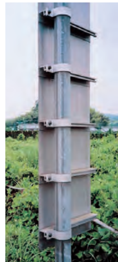
標識板 2 (既製材→アルミ板・高リブ・Uバンド・ 101.6 φ ポール使用)