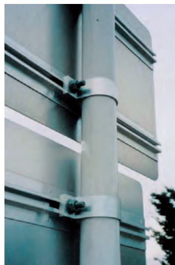
標識板 3のアップ写真